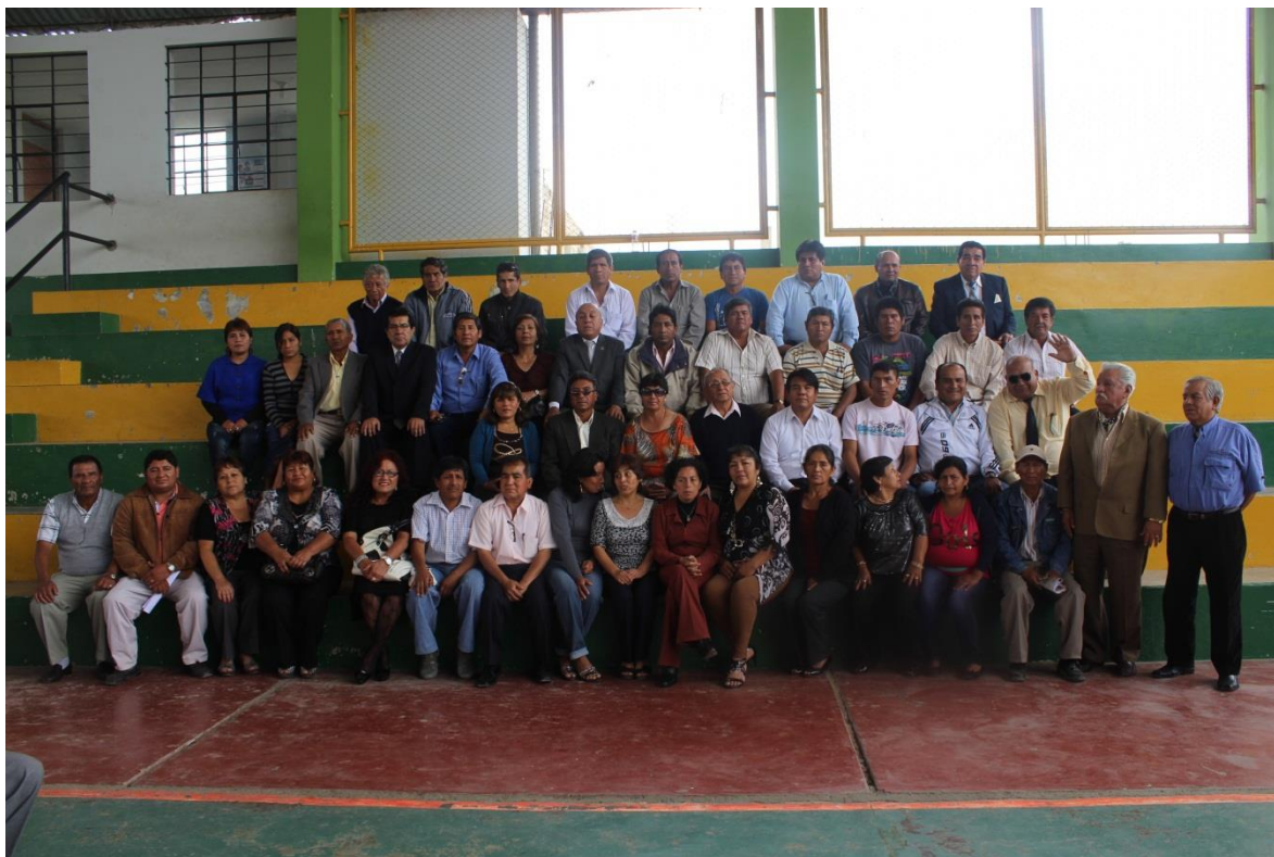
Alcaldes Vecinales del Distrito de Casa Grande juramentados, Noviembre del año 2013.

Para implementar espacios de participación es importante tomar en cuenta el escenario, la planificación y el monitoreo, los compromisos y el involucramiento de la población. Tal como se expresa en lo siguiente: “... la participación necesita ser organizada y la implementación de las iniciativas debe ser cuidadosamente planificada y monitoreada durante toda la vigencia de la experiencia considerada. A mi juicio, esta conclusión de estricto sentido común, pasa a menudo desapercibida por los responsables. En la práctica esta tarea incluye una explícita definición de “escenario” o estado de cosas que se espera alcanzar a mediano y corto plazo, una clara división y asignación de las responsabilidades y compromisos de cada uno de los actores participantes; y una programación de las metas a lograr en el tiempo y de los recursos que deberán aplicarse para ello. Por supuesto, para asegurar el éxito de una experiencia se requieren muchas otras precondiciones, pero más que apuntar a una enumeración taxativa, mi propósito es señalar que estos aspectos organizativos son tantos o más importantes que los propiamente sustantivos, o sea, los vinculados directamente con los resultados a lograr.